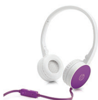
HP H2800 Headset, violett F6J06AA