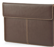
Custodia in pelle da 13,3" HP F3W21AA