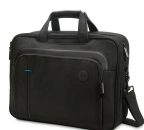
Mallette HP PME de 39,62 cm (15,6 pouces) à ouverture par le haut TOF83AA