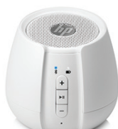
Haut-parleur sans fil blanc HP S6500 N5G10AA