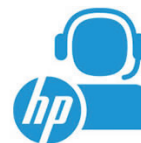
HP SmartFriend 1 mois HG382E

© Copyright 2015 HP Development Company, L.P. Les informations contenues dans ce document sont sujettes à modification sans préavis. Les seules garanties relatives aux produits et services HP sont énoncées dans les déclarations de garantie expresses fournies avec ces produits et services. Aucune déclaration du présent document ne saurait être interprétée comme une garantie supplémentaire. HP décline toute responsabilité pour les éventuelles erreurs ou omissions de nature technique ou rédactionnelle contenues dans ce document. Toutes les fonctionnalités ne sont pas disponibles dans toutes les éditions de Windows 8 et Windows 8.1. Les systèmes peuvent nécessiter des mises à jour et/ou l'achat de matériel, les pilotes et/ou logiciels supplémentaire pour profiter pleinement des fonctionnalités de Windows 8 et Windows 8.1. Reportez-vous à la page http://windows.microsoft.com/fr-FR/ . Toutes les autres marques commerciales sont la propriété de leurs détenteurs respectifs.