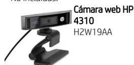
Cámara web HP 4310 H2W19AA