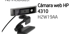
Cámara web HP 4310 H2W19AA