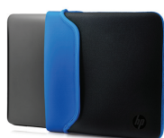
HP-neoprenetui til 33,78 cm (13,3"), sort/blå V5C25AA