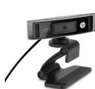
Webcam HP HD 4310 H2W19AA