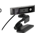
Веб-камера HD 4310 от HP Y2T22AA