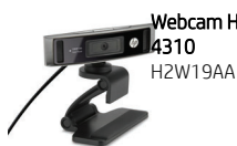
Webcam HP HD 4310 H2W19AA