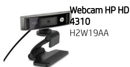
Webcam HP HD 4310 H2W19AA