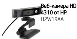
Веб-камера HD 4310 от HP H2W19AA