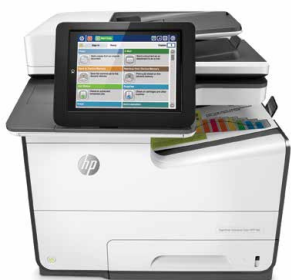
HP PageWide Enterprise Color MFP 586dn

當今企業最超值的選擇 — HP PageWide 技術提供最快速度 1 配備最高安全性 2 ，總體擁有成本在同等機型中驚創最低！ 3 搭配無縫工作流程功能，超高生產力全面爆發。