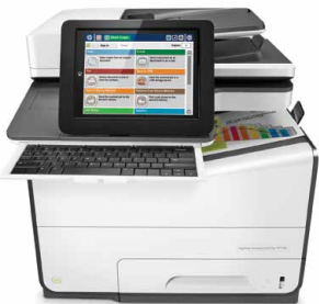
HP PageWide Enterprise Color Flow MFP 586z