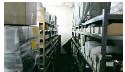
Elementos confiscados en Italia (arriba) y en Alemania (abajo)