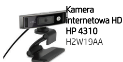
Kamera internetowa HD HP 4310 H2W19AA