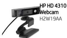
HP HD 4310 Webcam H2W19AA