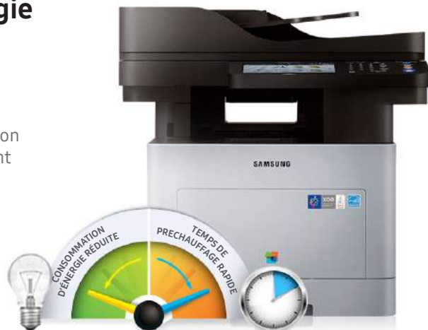
Technologie IFS de Samsung