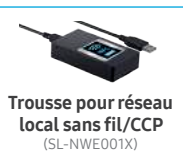
Trousse pour réseau local sans fil/CCP (SL-NWE001X)