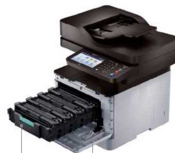
Cartouche d'encre Panneau avant