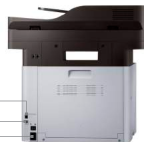
Port réseau Port USB Connecteur d'alimentation