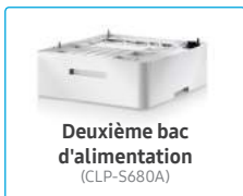
Deuxième bac d'alimentation (CLP-S680A)