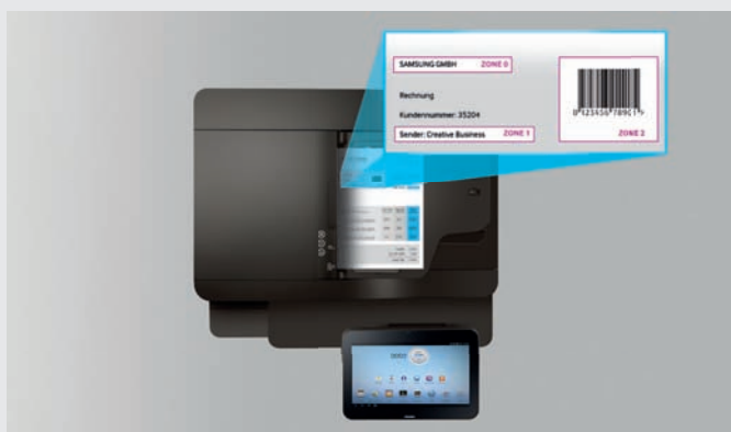
Dokumenttypen anhand von Barcodes automatisch klassifizieren oder große Dokumente in einzelne Abschnitte aufteilen.