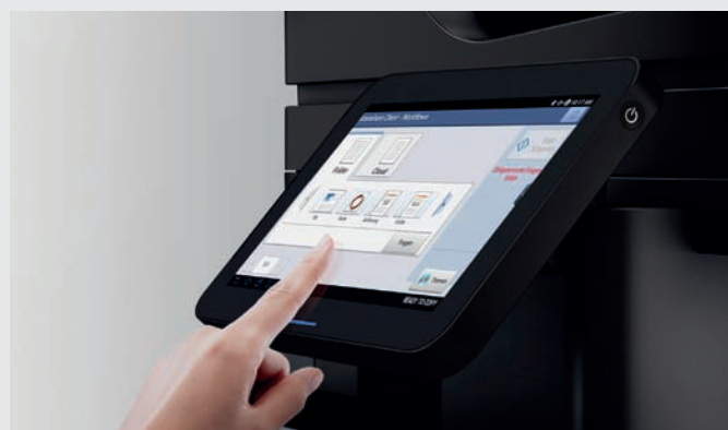
One-Touch-Scannen über ein MFP-Bedienfeld zum Erfassen und Konvertieren von Dokumenten in entsprechende Formate.