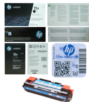
Voorbeeldfoto's voor het rapporteren van een tonercartridge