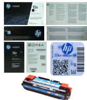
Przykładowe zdjęcia dla zgłoszenia dot. wkładu z tonerem