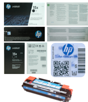
Ilustračné fotografie pre nahlásenie kazety tonera