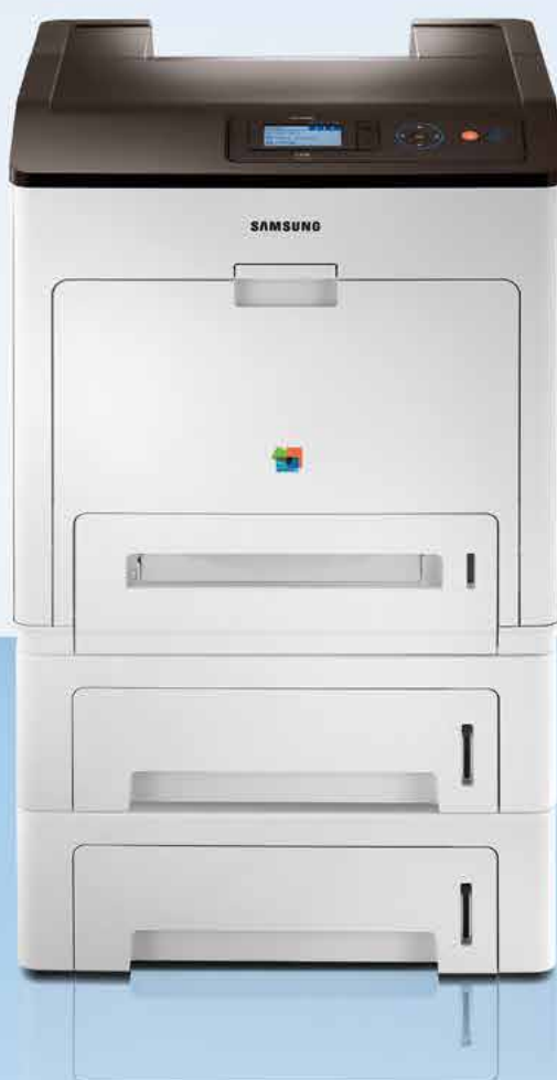
Abb.: CLP-775ND mit Optionen