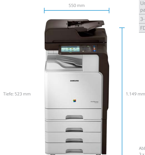
Abb.: C8640ND mit optionalem 3 x 520-Blatt-Zusatzpapiermagazin