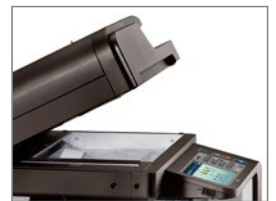
MultiXpress C8641ND / C8651ND in der Standard-Ausstattung