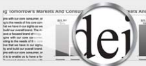
Funkcja De-ICE (Integrated Cavity Effect)