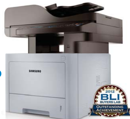
Награда «Выдающееся достижение» в категории «Инновации»: драйвер Samsung Easy Eco