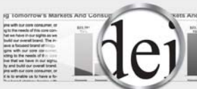
Funkcja De-ICE (Integrated Cavity Effect)