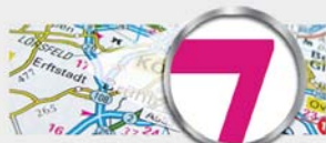
Redukcja barw złożonych