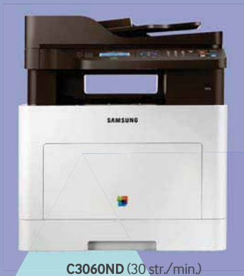
C3060ND (30 str./min.)