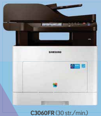
C3060FR (30 str./min.)