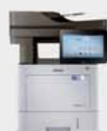
M4580FX (45 ppm)