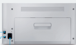
Ingresso di rete* Porta USB