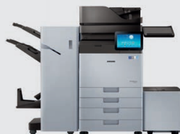
K7600LX/GX* : bis zu 60 S./Min.