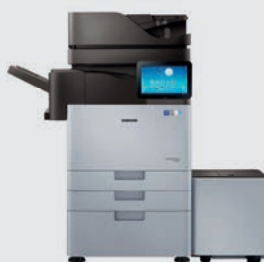
K7500LX/GX* : bis zu 50 S./Min.