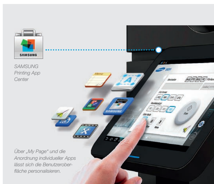
Über „My Page“ und die Anordnung individueller Apps lässt sich die Benutzeroberfläche personalisieren.