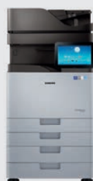
K7400LX/GX* : bis zu 40 S./Min.