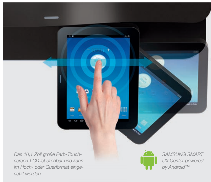
Das 10,1 Zoll große Farb-Touchscreen-LCD ist drehbar und kann im Hoch- oder Querformat eingesetzt werden.

Die smarte SAMSUNG MX7-Serie erleichtert die tägliche Arbeit und ermöglicht das Öffnen und Bearbeiten von Dokumenten direkt am Gerät – ganz ohne PC. In der Vorschau-Funktion können gescannte Dokumente nachträglich bearbeitet werden. Darüber hinaus ermöglicht der Webbrowser, verschiedenste Webinhalte wie Karten, Bilder oder E-Mails direkt abzurufen und bei Bedarf auszudrucken.