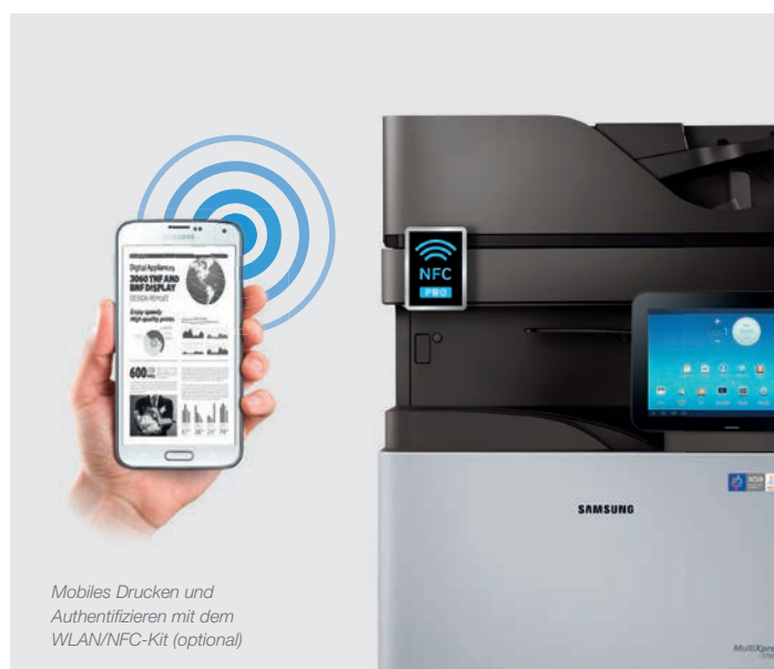
Mobiles Drucken und Authentifizieren mit dem WLAN/NFC-Kit (optional)

SAMSUNG SMART UX Center powered by Android™