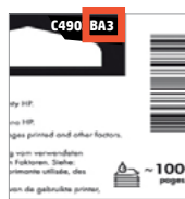
Opção de idioma

Esta descrição geral está sujeita a atualizações regulares. Consulte a versão atual em hp.com .