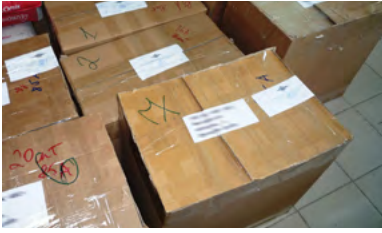
العناصر التي تم ضبطها في نيجيريا (أعلى) وروسيا (أسفل)

قامت السلطات المحلية مؤخرًا باتخاذ العديد من إجراءات إنفاذ القانون المهمة لمكافحة التزييف بشتى أنحاء أوروبا والشرق الأوسط وأفريقيا، وقد تم ذلك بدعم وثيق من خبراء برنامج مكافحة التزييف والغش (ACF) من HP. ويوضح التعاون الناجح مدى حرص HP في عملها على حماية عملائها - محققة بذلك نتائج مبهرة: فمن مايو 2017 وحتى أكتوبر من العام نفسه، قامت السلطات بضبط ما يقرب من 1.6 مليون من خراطيش الحبر ومنتجات الكمبيوتر المزيفة التي تحمل علامة HP بشكل غير قانوني فضلًا عن منتجات أخرى ذات صلة.