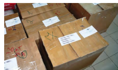
In Nigeria (oben) und Russland (unten) beschlagnahmte Artikel