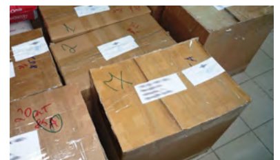
Товары, конфискованные в Нигерии (вверху) и в России (внизу)