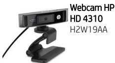
Webcam HP HD 4310 H2W19AA