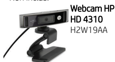
Webcam HP HD 4310 H2W19AA